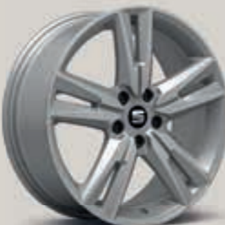
Performance III FR