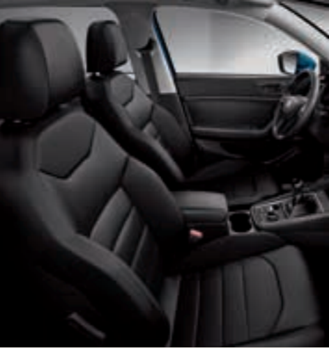
Sportovní sedadla, kůže BB+WL1