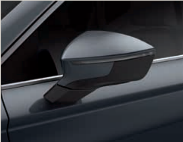
Šedá Rodium 2 St XE FR