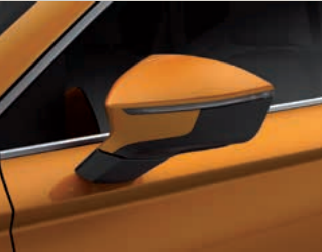
Oranžová Samoa 2 St XE FR