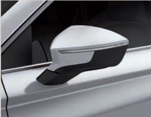
Bílá Nevada 2 St XE FR