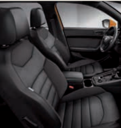
Sportovní sedadla, Alcantara®/ tkanina/umělá kůže DV+PL3