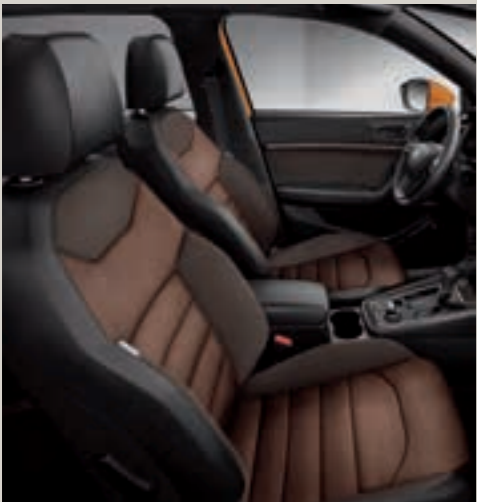
Sportovní sedadla, Alcantara®/ tkanina, hnědý interiér EE