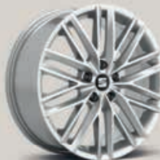
Performance I XE