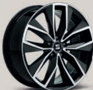
Exclusive I – broušená XE