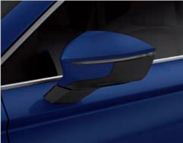
Modrá Energy 1 St XE FR