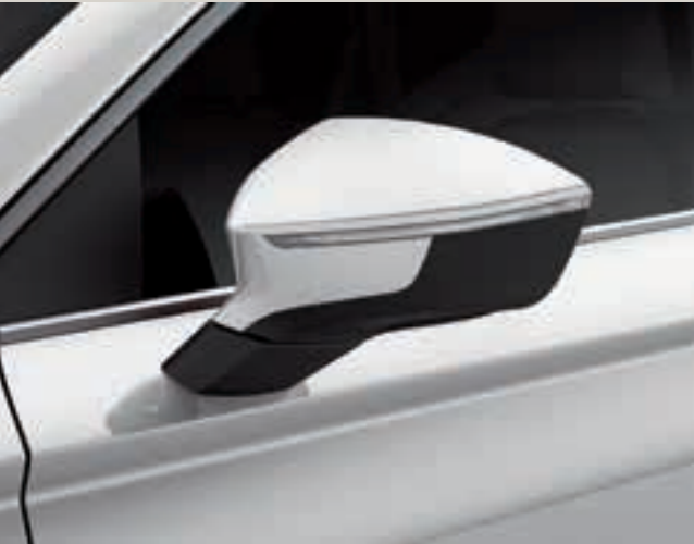
Bílá Bila 1,3 St XE