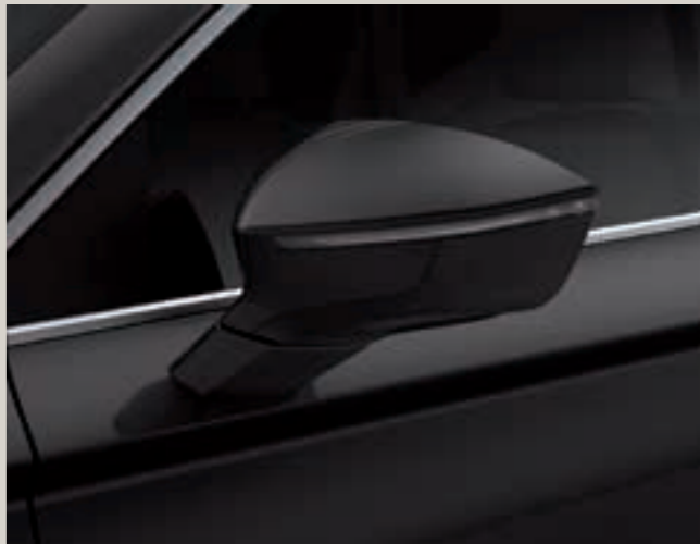
Černá Magic 2 St XE FR