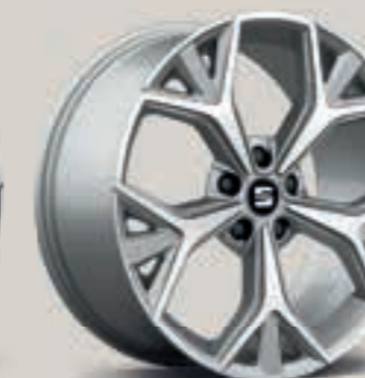
Stříbrná Aneto St XE FR