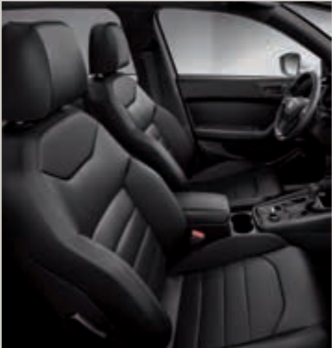
Sportovní sedadla, kůže DV+WL1