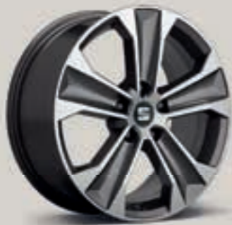
Dynamic II – broušená St