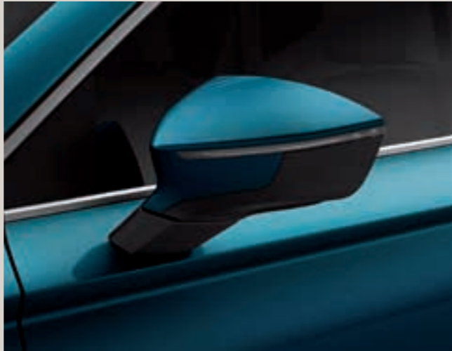
Modrá Lava 2 St XE