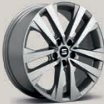
Stříbrná Puigmal St XE FR