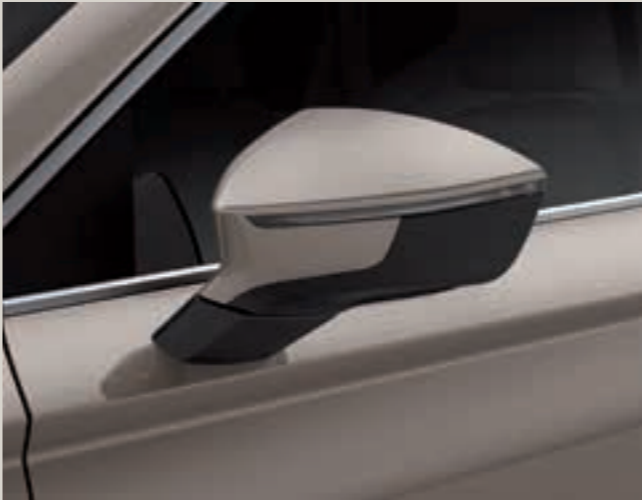
Béžová Capuccino 2,4 St XE