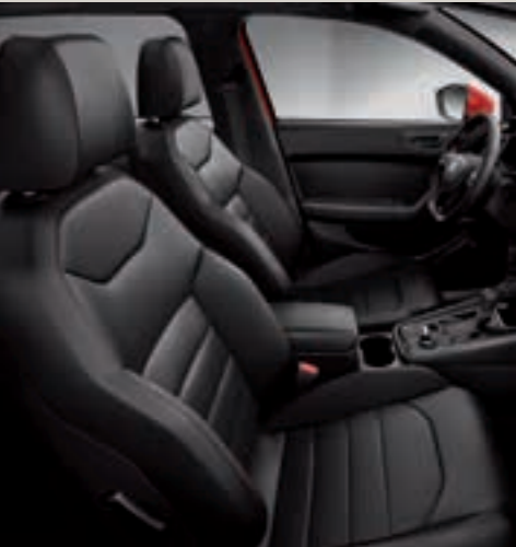
Sportovní sedadla, kůže ME+WL1