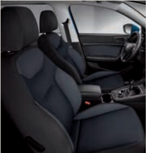
Komfortní sedadla, tkanina BB