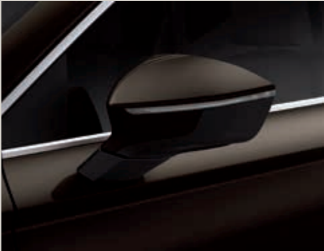
Hnědá Magnetic 2 St XE

Style St Xcellence XE FR FR Standardní výbava ■ Výbava na přání ■