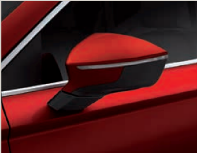
Červená Velvet 2 St XE FR