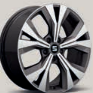
Performance II – broušená St XE