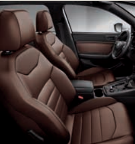
Sportovní sedadla, kůže, hnědý interiér EE+PL3