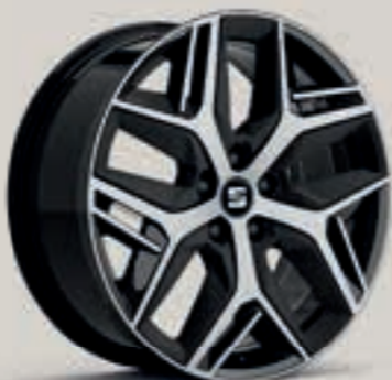
Exclusive II – broušená FR