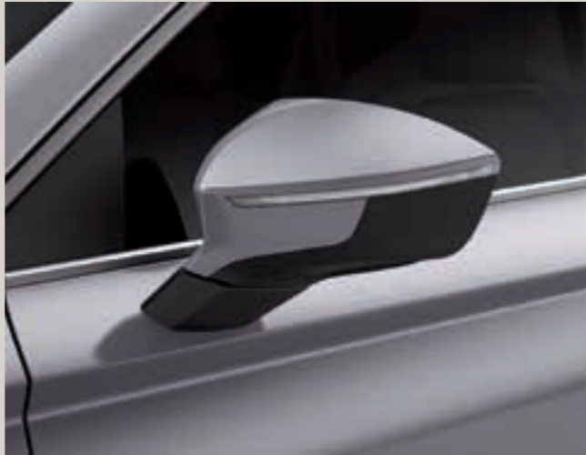
Stříbrná Brilliant 2 St XE