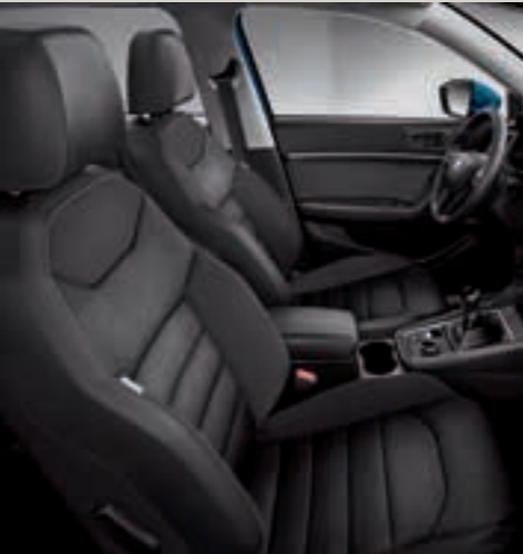
Sportovní sedadla, Alcantara®/tkanina/umělá kůže BB+PL3