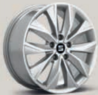
Dynamic I St