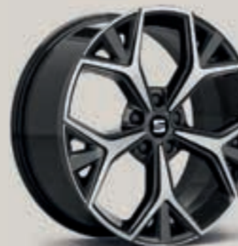
Černá Aneto St XE FR