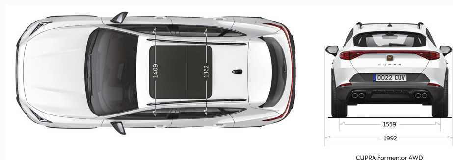
CUPRA Formentor 4WD