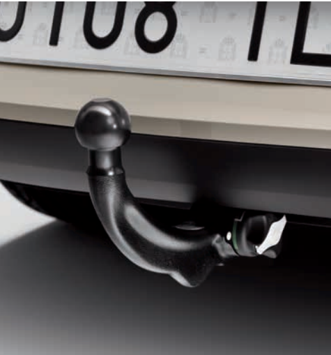
tažné zařízení odnímatelné