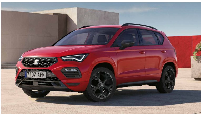
19" lesklá černá kola z lehkých slitin Exclusive IV