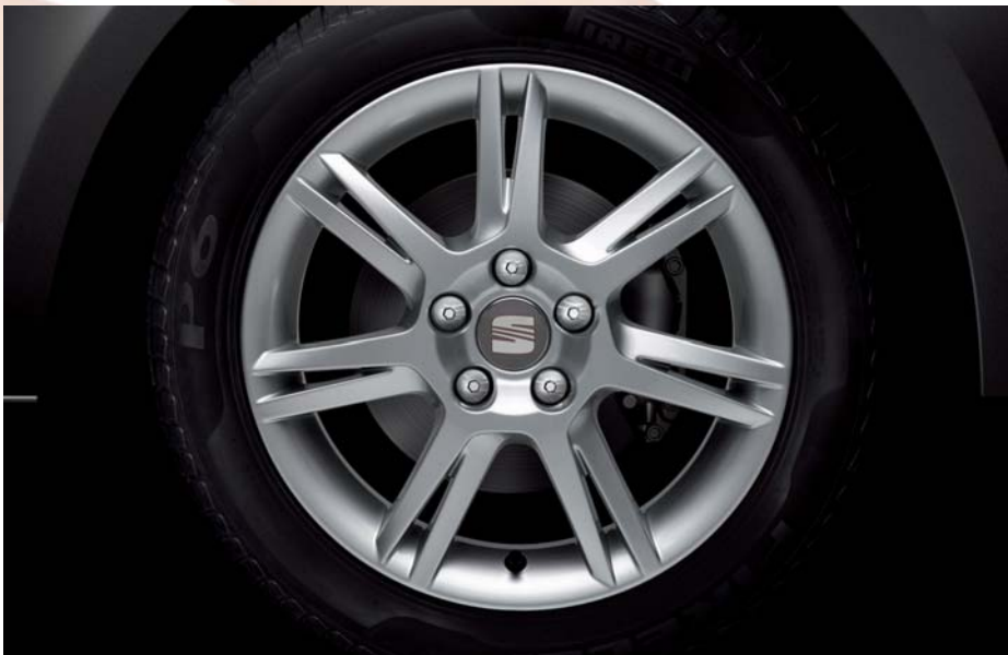
▶ 15" kola z lehkých slitin „INGENIA“