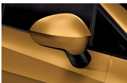
Tribu – 8R8R Speciální lak Ib R St