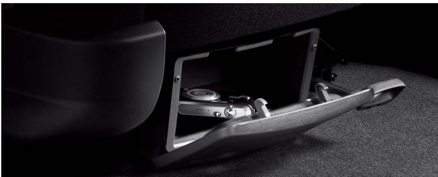
▼ Odkládací schránka pod sedadlem řidiče (zahrnuta v paketu „Schránky“ a dodávaná pro model Ibiza ST)