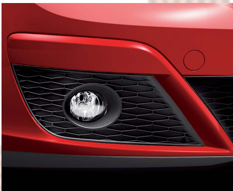
▶ Přední mlhovky s integrovanou funkcí odbočovacích světel