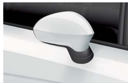
Newada bílá – 2Y2Y Metalický lak L R St