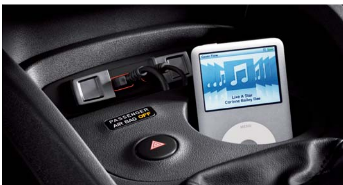
Multimediální port (USB/AUX in)