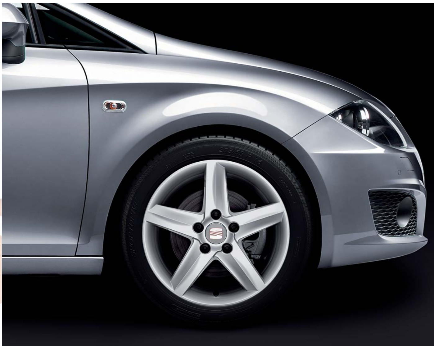
▼ 16" kola z lehkých slitin „ELIO“