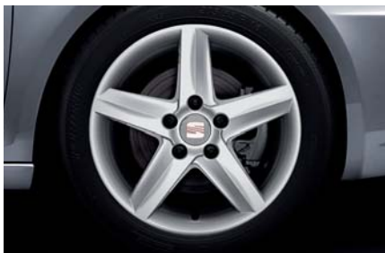
16" kola z lehkých slitin „ELIO“