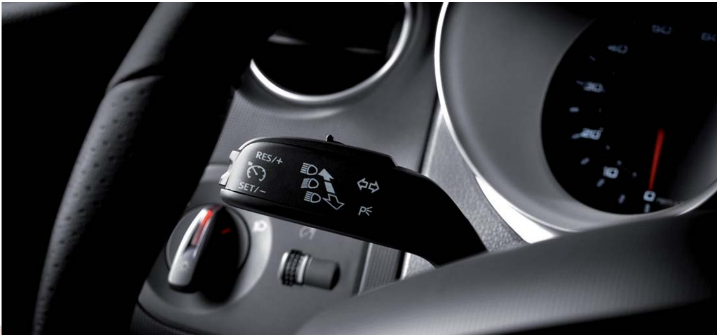
Tempomat a přední mlhovky s integrovanou funkcí odbočovacích světel