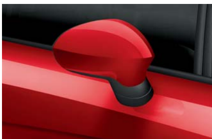
Emoción červená – 9M9M Nemetalický lak Ib L Alt R St