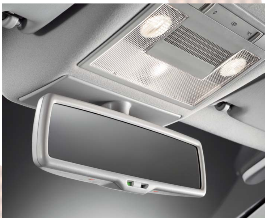
▶ Automaticky zatmavitelné vnitřní zpětné zrcátko