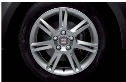
15" kola z lehkých slitin „INGENIA“