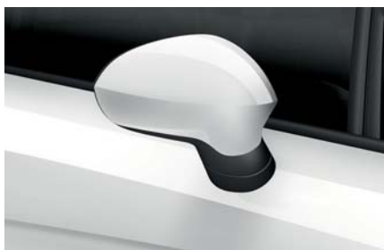
Bílá – B4B4 Nemetalický lak Ib L Alt R St