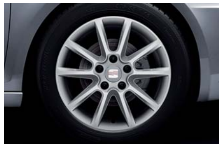
16" kola z lehkých slitin „ENEAL“