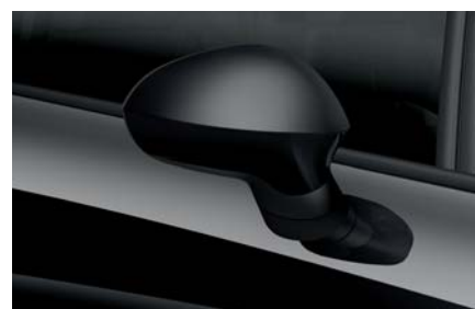
Magico černá – Z4Z4 Metalický lak Ib L Alt R St