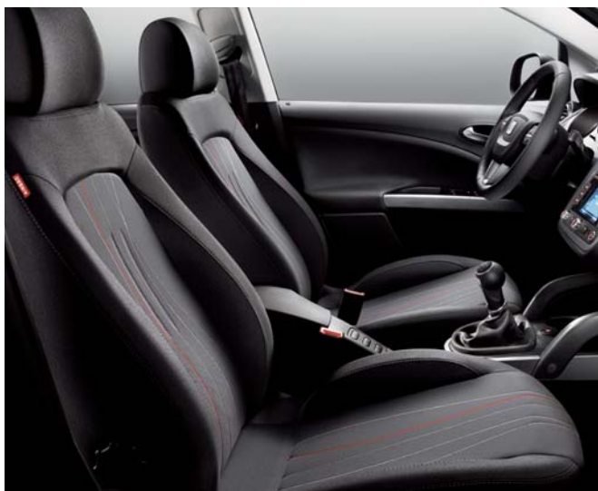
33 PCR – COPA