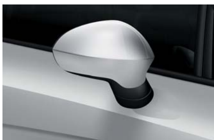
Luna šedá – K4K4 Metalický lak Ib L Alt R St