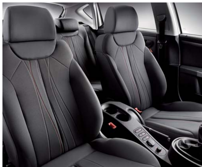
33 PAR – COPA