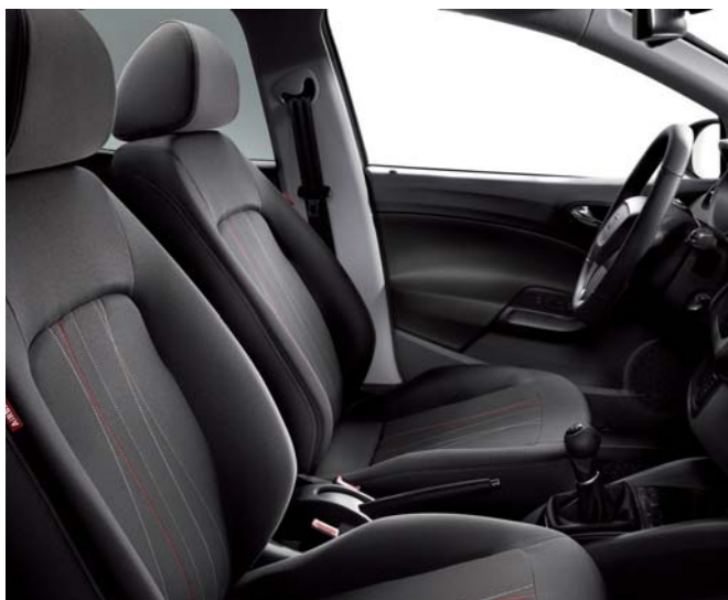
34 ZK1 – COPA 33 PCR – COPA