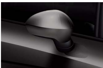
Track šedá – 2V2V Metalický lak Ib L R St