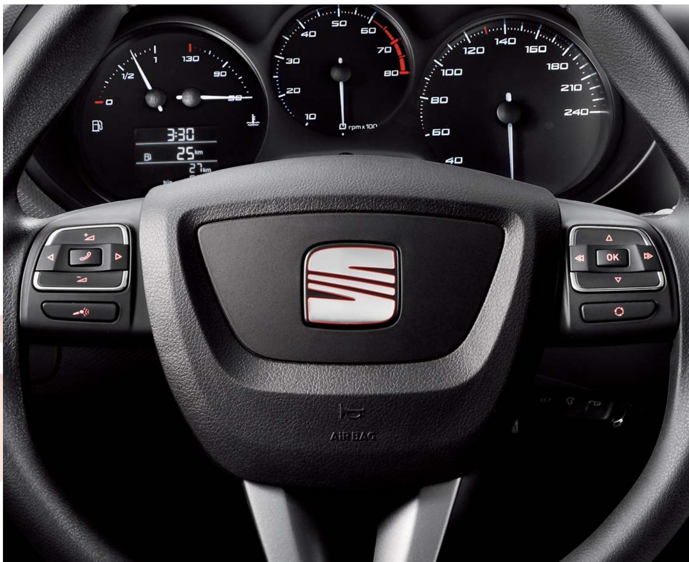
▼ Multifunkční volant