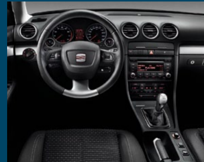
volant obšitý kůží