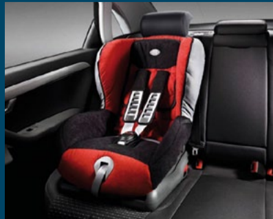
dětská sedačka RECARO YOUNG SPORT