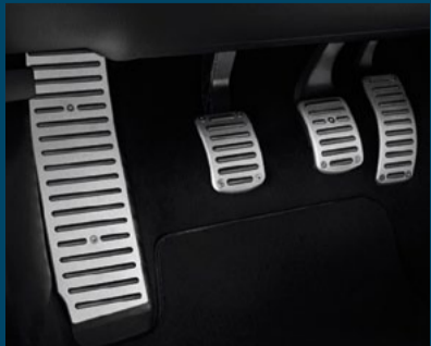
sada sportovních pedálů