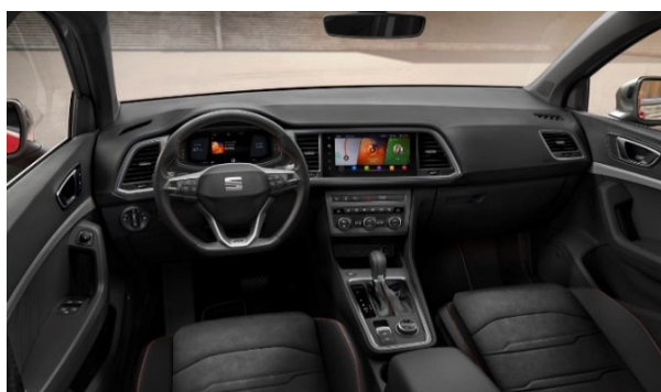
Digitální přístrojový štít s 10,25" barevným TFT displejem

Bezdotykové elektrické ovládání 5. dveří + Alarm